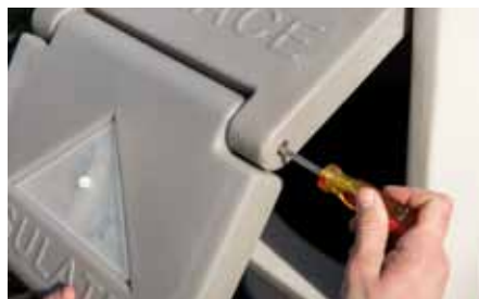
Unscrew right hand hinge bushing with phillips screwdriver